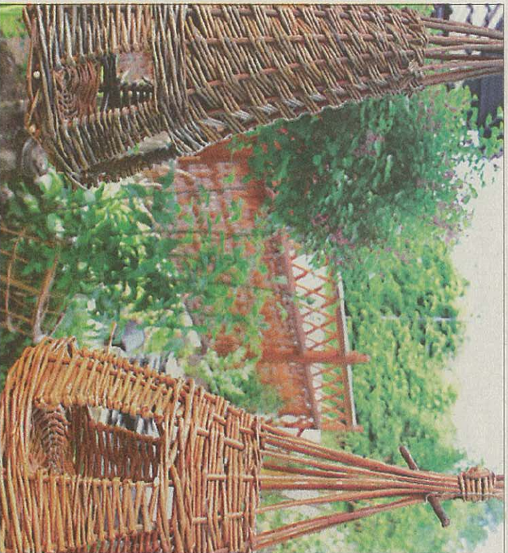
FUGLEMAT: Produkt i pil kan nyttast til mykje, mellom anna til å gje fuglane mat.

kurs både måndag, tysdag og onsdag. Men ho satsar på ein lang sommarferie.