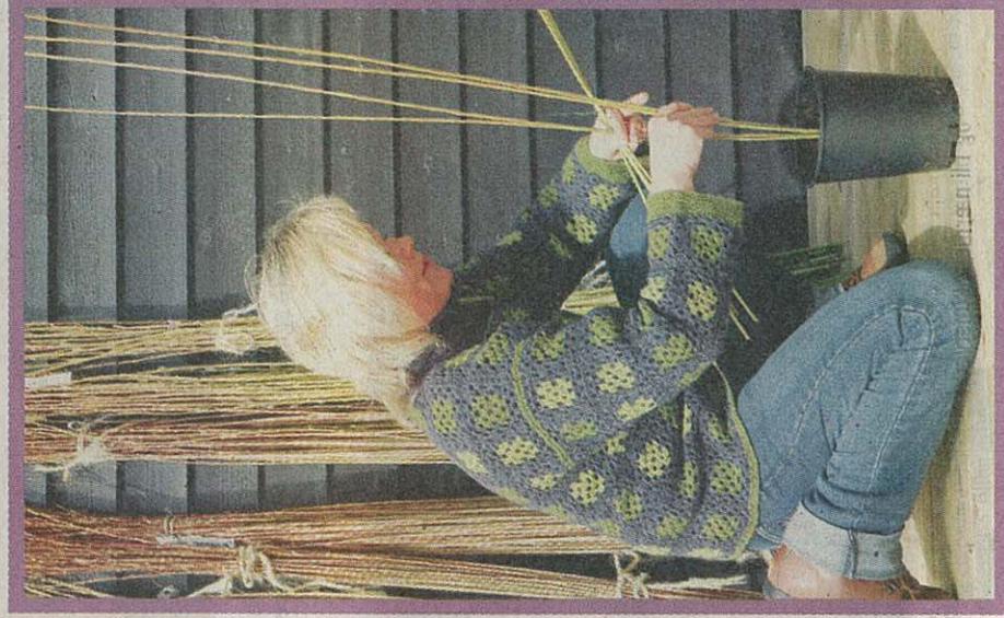
KNYTE, KNYTTE: Teknikken er så flettes de parvis oppover til flettverket på plass av knuter.