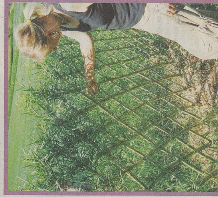
UTE: Slik blir det ute, og med tiden vil pilen vokse seg enda litt tettere.